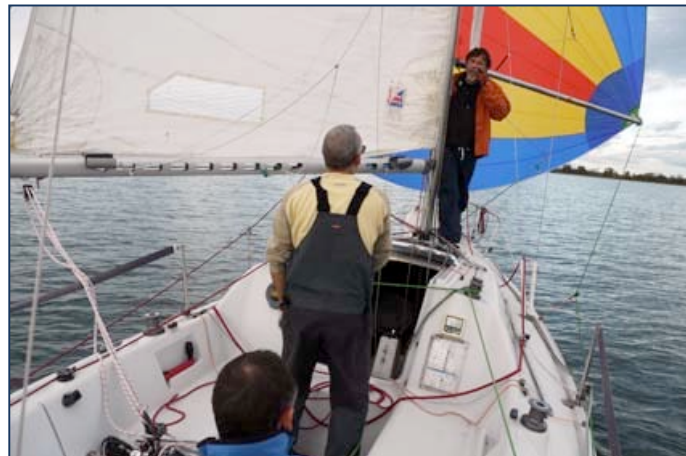
Le bateau porte son nouveau spi de 50 m 2 acheté en 2018.

Concernant son entretien, il est fait régulièrement par les équipiers et/ou membres du club pour que le bateau reste convenable et performant après 22 ans de navigation.